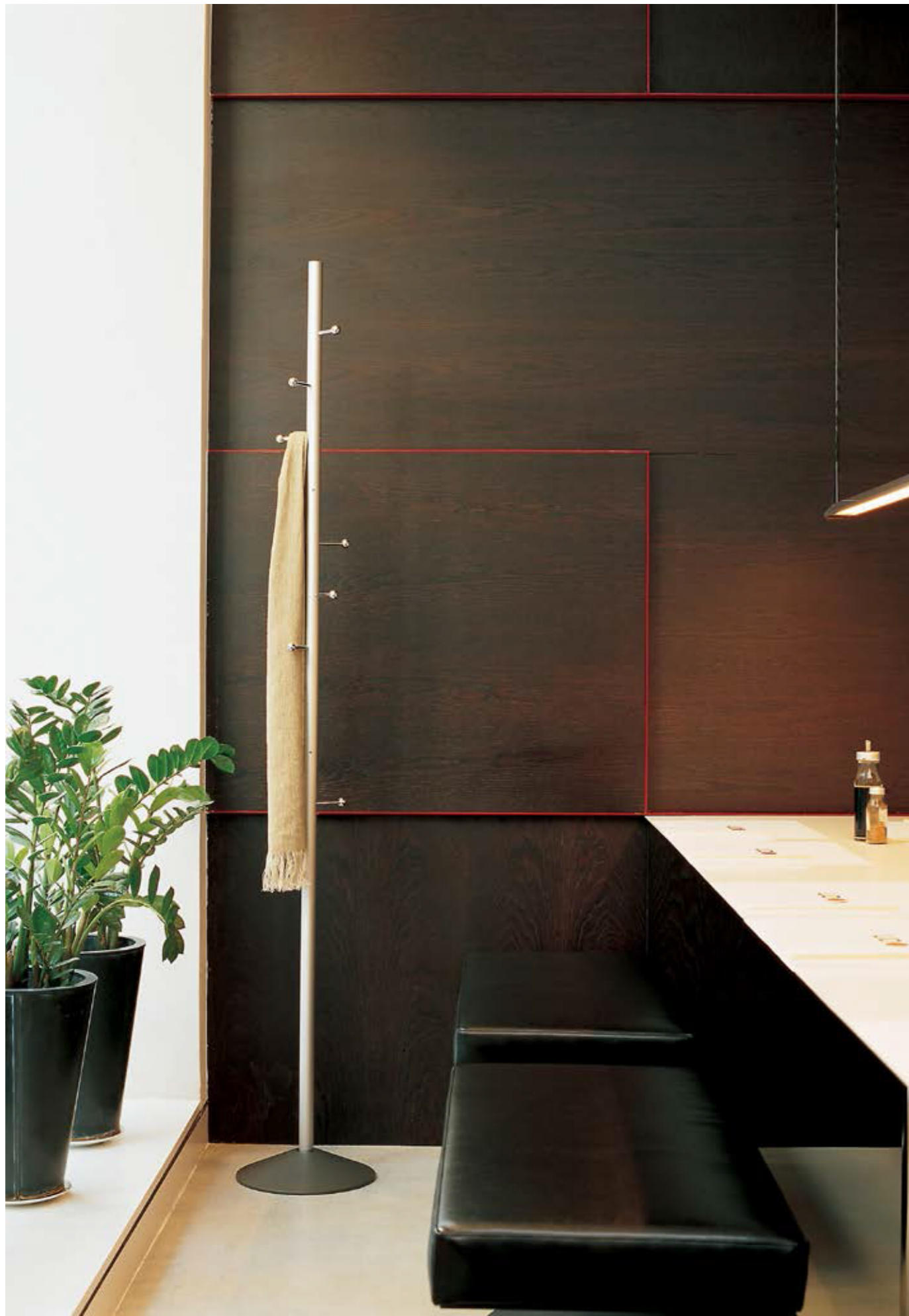
Mobles 114 | Complements