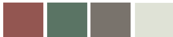
Bordeaux PANTONE 1815U Dark green PANTONE 554U Dark grey PANTONE 405U White RAL 9002