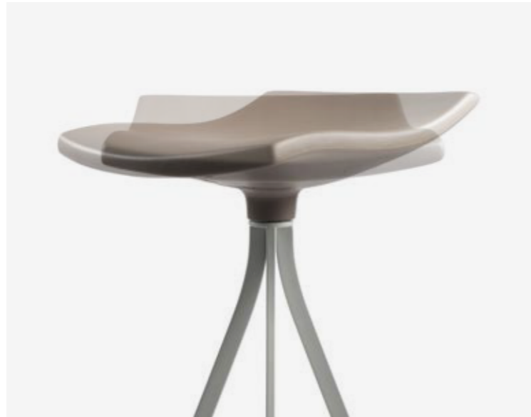
Swivel polyurethane foam seat