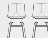
2 Green disassembled simple assembly